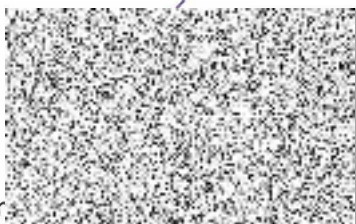
Ir. předseda výboru